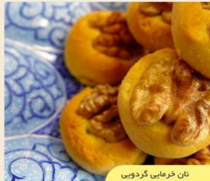
نان خرمایی گردویی

دامی استان کرمانشاه بوده و بسیار خوشبو و معطر است. استفاده از روغن حیوانی در پخت شیرینی های کرمانشاه طعمی فراموش نشدنی به این شیرینی می دهد.