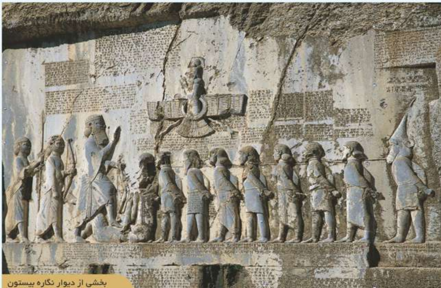
بخشی از دیوارنگاره بیستون

نقش برجسته و کتیبه داریوش یکم (دوره هخامنشی): این نقش برجسته که بزرگ ترین کتیبه سنگی جهان