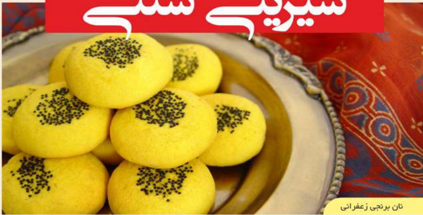
نان برنجی زعفرانی