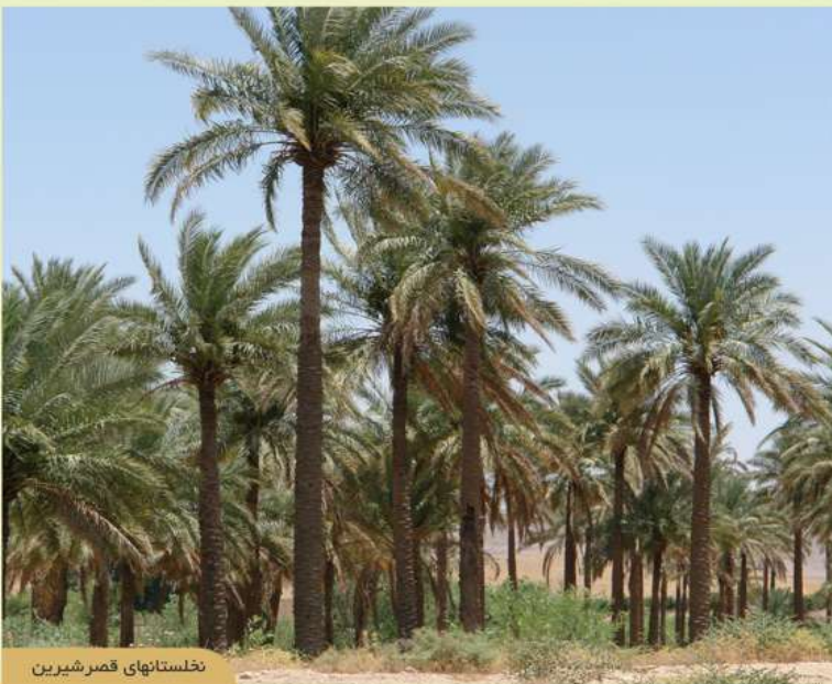
نخلستانهای قصر شیرین

زبان مردم این شهرستان کردی و گویش های آنها کلهری، سنجایی و جافی می باشند. روستاهای این شهرستان در بیشتر فصول سال از مقاصد گردشگران استان می باشند.